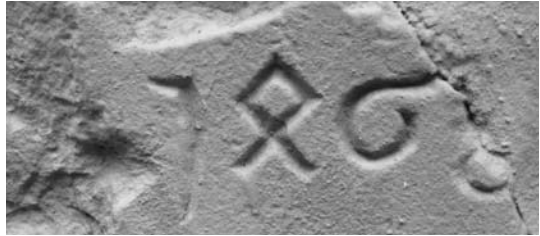
Jahreszahl 1468 als Spolie im Brunnenhäuschen des Kreuzgangs vermauert

Egal ob in Holz geschnitzt, in Bronze gegossen oder in Stein geschlagen gehören Inschriften – neben den archivalischen Überlieferungen – zu den wichtigsten Quellen in Kirchen und Klöstern. Umso bedauerlicher ist es, dass im ehemals so reichen Stift Ravengiersburg kaum etwas die Zeiten überdauert hat. Denn nach einer